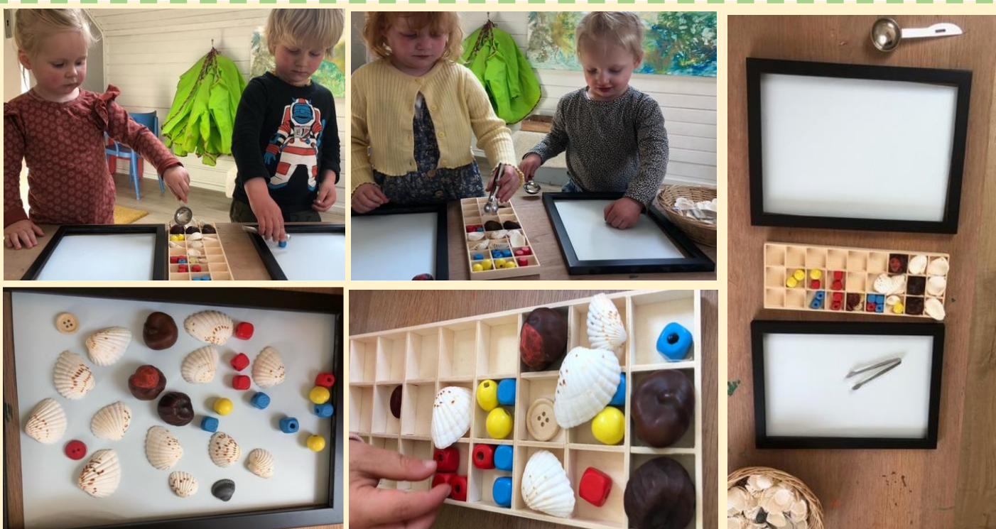
Een activiteit geïnspireerd door de studiereis in Zweden

Na een roerige periode rondom Corona, met zelfs een week sluiting, komt steeds meer het zonnetje in het zicht en verdwijnt corona gelukkig steeds meer naar de achtergrond. Om ervoor te zorgen dat er zoveel mogelijk vaste gezichten te zien zijn bij Tante Tuit, zal Anik het team Tante Tuit komen versterken. Wijzig hierdoor jullie mentor dan is het in de loop van de maand mei zichtbaar in Bitcare.